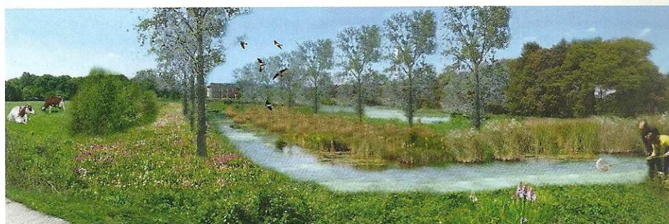
Impressie Molenvaardeken vanaf het fietspad ter hoogte van Terdonk (Doornzele)