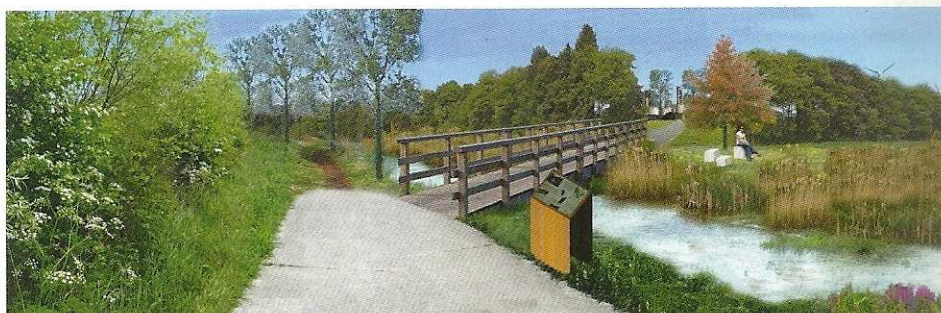
Impressie fietspad en omgeving Gaverstraatje (Doornzele)

De dorpskernen van Kerkbrugge, Doornzele en Rieme palen aan de haven van Gent. Om de leefbaarheid in deze dorpskernen te garanderen, zijn onder meer koppelingsgebieden voorzien. Dit zijn gebieden die de woonkernen en de industriegebieden van elkaar scheiden en op termijn een belangrijke bufferende functie zullen hebben. De Vlaamse Landmaatschappij (VLM) heeft de voorbije jaren plannen uitgewerkt voor de invulling van deze koppelingsgebieden. Nu is het tijd om deze plannen uit te voeren op het terrein.