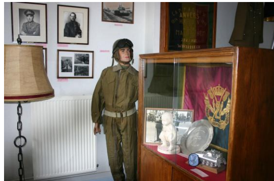
en zaal 2