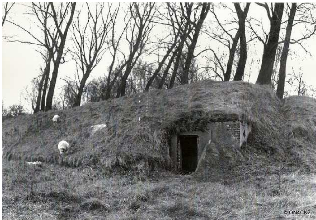
Het kleine bunkertje aan de kanaalzijde

De loods was zwaar getroffen door een bominslag, het dak was volledig weg, er was volop begroeiing van struiken, netels enz. Op het einde van de loods woonde in een hooggelegen nis een uilenfamilie.