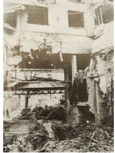
Cinema Rex na de ramp met 567 doden.

We herdenken de 75ste verjaardag van het begin van de Tweede Wereldoorlog in ons land. De 'grote' verhalen van die oorlog zijn genoegzaam bekend, de 'kleine' veel minder. Ten onrechte. In deze zevendelige reeks brengen wij de buitengewone oorlogsverhalen van zeven gewone Belgen. Nu eens herkenbaar, dan weer wraakroepend, altijd aangrijpend.