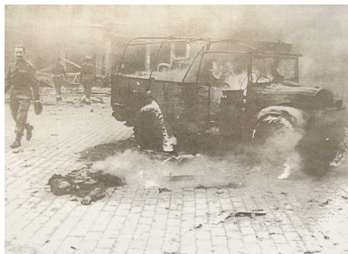
Eén van de 857 V-bommen die op Antwerpen vallen. Hier: op de Teniersplaats.