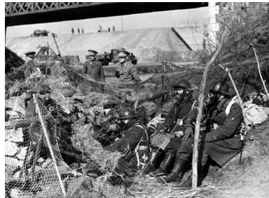
Op het ergste voorbereid: Belgische soldaten, met gasmaskers, tijdens manoeuvres.