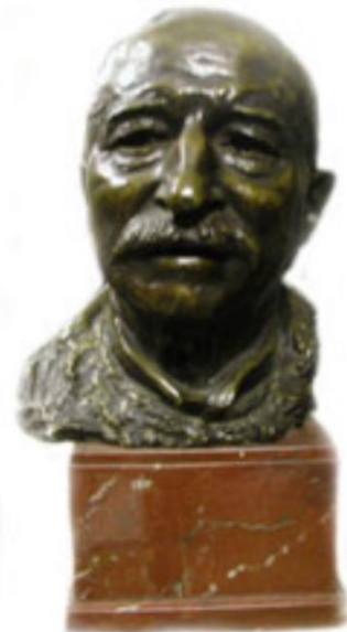
Links : monument op de Stedelijke Begraafplaats in Nieuwpoort. Rechts : Buste door beeldhouwer Karel Ialoo