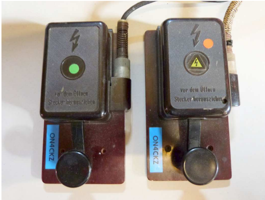
Een van deze Seinsleutels stond in een Duitse seinpost.