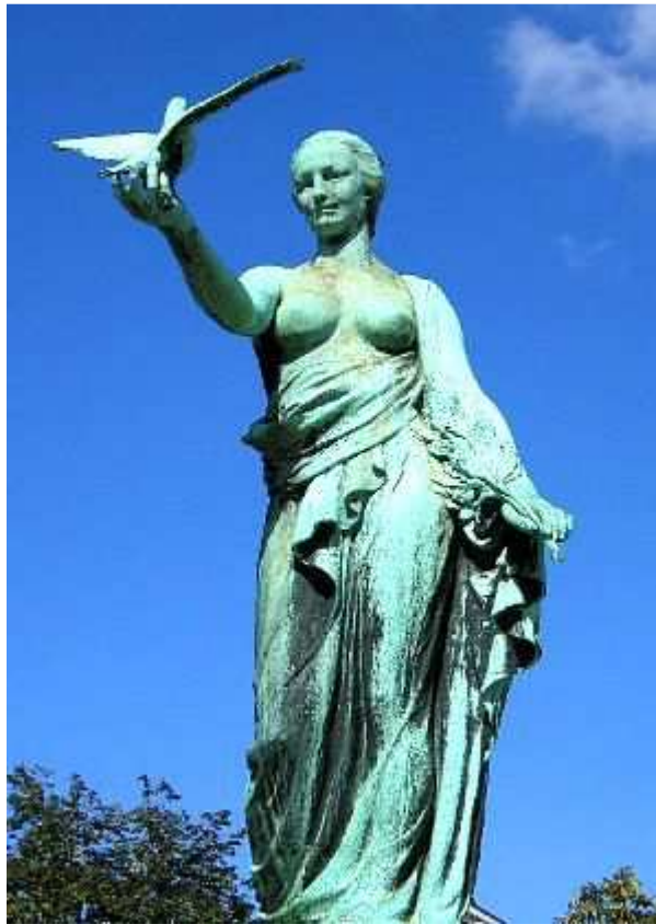
Monument ter ere van de oorlogsduiven van WO I te Brussel

nagedachtenis van de duizenden postduiven die omkwamen gedurende de oorlog. De duiven werden in die tijd beschouwd als helden en zoals dat gaat met helden, de verhalen eromheen werden steeds mooier.