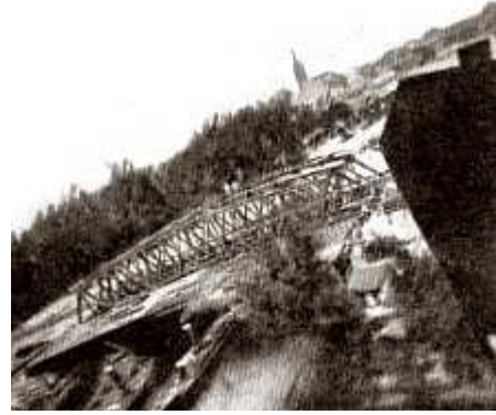
Dat waren nog flinke fototoestellen die de spionageduiven meestorsten. Rechts een foto gemaakt door zo'n spionageduif.

Ook werden duiven nog op een andere manier ingezet voor spionagedoeleinden. Al voor de oorlog hadden de Duitsers kleine fototoestellen ontwikkeld die bij de duiven voor de borst werden bevestigd. Terwijl de duif vloog, was het via een vernuftig mechaniek mogelijk om op bepaalde hoogte op diverse plaatsen opnames te maken van het landschap. Dat leverde bijvoorbeeld afbeeldingen op van vijandelijke loopgraven.