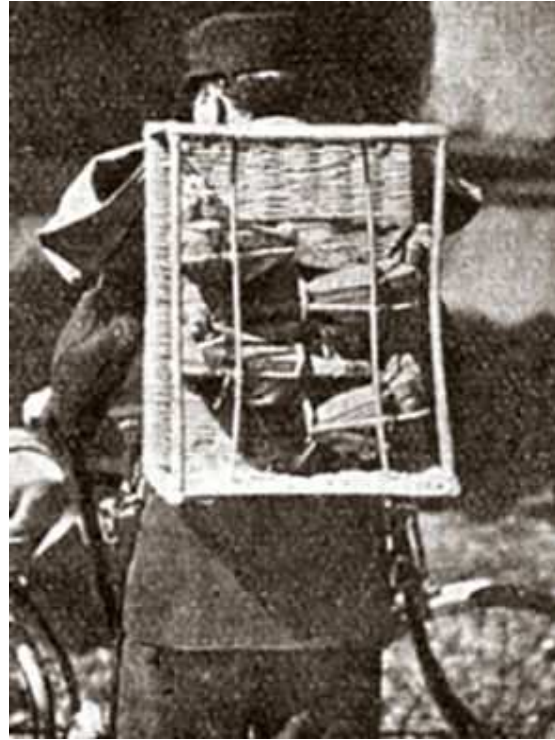
Links: Bij een gasaanval worden de duiven in veiligheid gebracht in het gaskastje. Rechts: Een verende duiventransportmand waarin de duiven tijdens het vervoer niet schokken