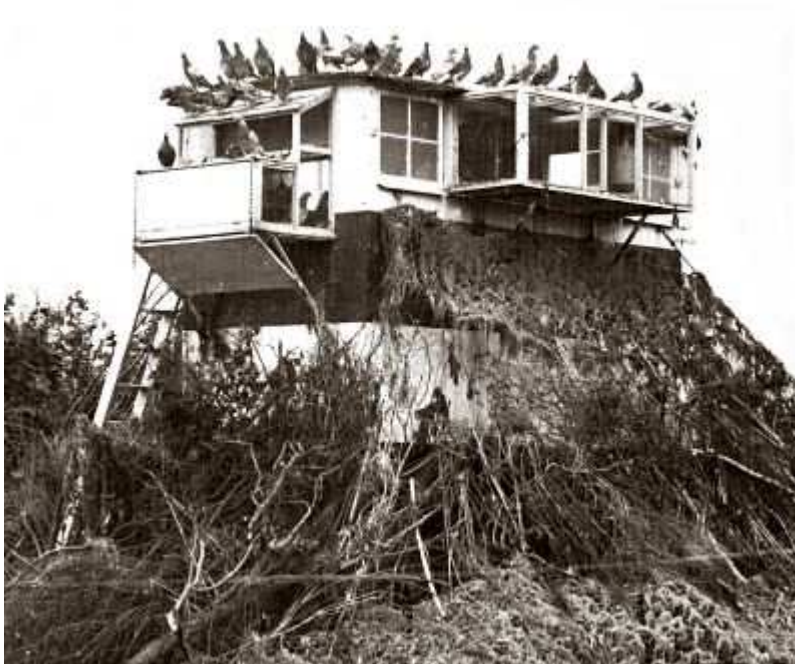
Een gecamoufleerd militair Brits duivenhok