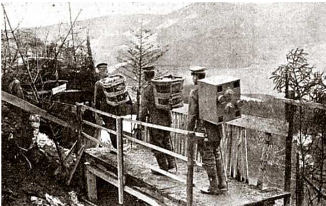
Boven: Het vervoer van de duiven naar de (Duitse) loopgraven. Let op het duivengaskastje op de rug van de achterste man!

In enkele gevallen heeft men mandjes met duiven uit een luchtballon neergelaten. De mandjes hingen aan parachutes en sprongen na verloop van tijd automatisch open. Die duiven bezorgden bijvoorbeeld berichten over vijandelijke troepenbewegingen.