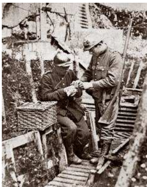
Duif wordt losgelaten in een Belgische loopgraaf

De hedendaagse postduif komt uit België. Uit verschillende kruisingen ontstond circa 1850 de Belgische "reisduif". De postduivensport heeft op de ontwikkeling van de vogel grote invloed gehad. Reeds in het begin van de 19e eeuw werden wedvluchten georganiseerd in Luik, Gent, Brussel en Antwerpen. Na 1850 is de postduif vanuit België geïntroduceerd in Noord Frankrijk, daarna in Nederland, Duitsland, Engeland etc. Rond 1900 is deze duif met de bijbehorende sport over vrijwel de gehele wereld verspreid. Ook voor militaire toepassingen is vanaf 1870 van deze Belgische duif gebruik gemaakt.