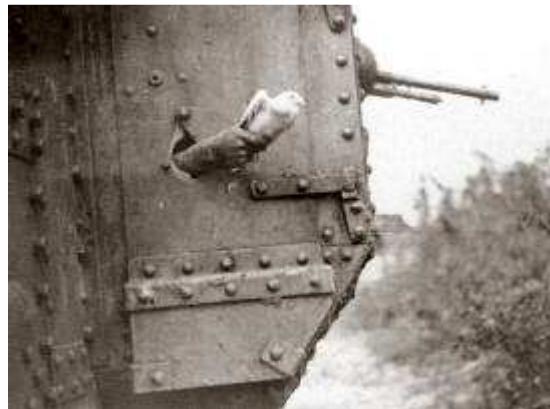
Duiven werden ook gebruikt om vanaf duikboten en vanuit tanks berichten te verzenden.

De duiven deden hun klus vaak onder gevaarlijke omstandigheden: beschietingen, bombardementen. Juist onder die hectische oorlogsomstandigheden had je ze nodig omdat telefoon en telegraaf dan menigmaal onbruikbaar waren.