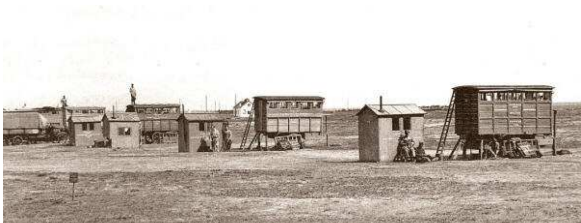
Kamp Beverloo, een Belgisch militair duivenstation

Sinds het beleg van Parijs zag iedereen in dat de postduif van veel betekenis was voor de communicatie. Enkele feiten. Het Duitse leger richtte een militaire postduivendienst op met stations in verschillende steden. Rusland kocht in België 5000 duiven. De Franse regering liet in Parijs een postduivenstation inrichten voor 25.000 duiven, terwijl elk legerkorps een detachement van 500 postduiven kreeg. Elke vesting die kans liep langere tijd te worden ingesloten kreeg maar liefst 1000 duiven toegewezen.