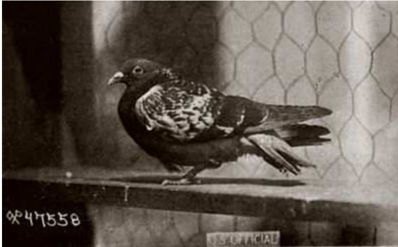
De gehavende Cher Ami - de dappere doffer

Infantry Division, dat geheel geïsoleerd was geraakt van de andere Amerikaanse troepen en hopeloos onder vuur lag. Cher Ami had de veertig kilometer naar het Amerikaanse hoofdkwartier afgelegd in 25 minuten. Binnen enkele uren konden de Amerikanen het bataljon bevrijden en waren 194 levens gered!