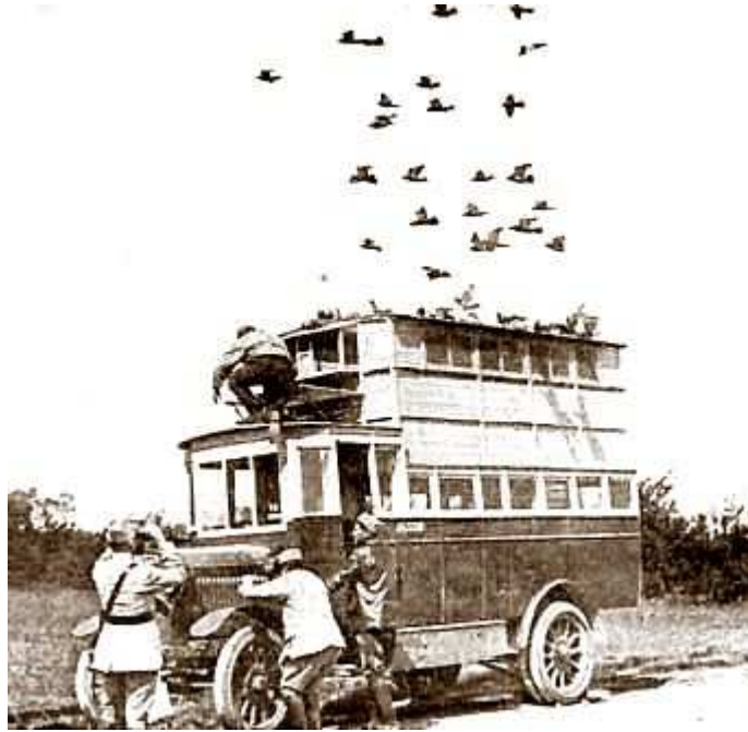
Een mobiel Frans duivenstation