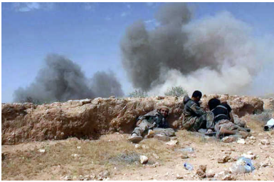
IS-strijders schuilen tijdens de strijd om Palmyra.