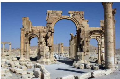
Palmyra staat bekend om zijn archeologische sites die ook op de UNESCO-werelderfgoedlijst staan. Gevreesd wordt dat IS alles met de grond gelijk zal maken.