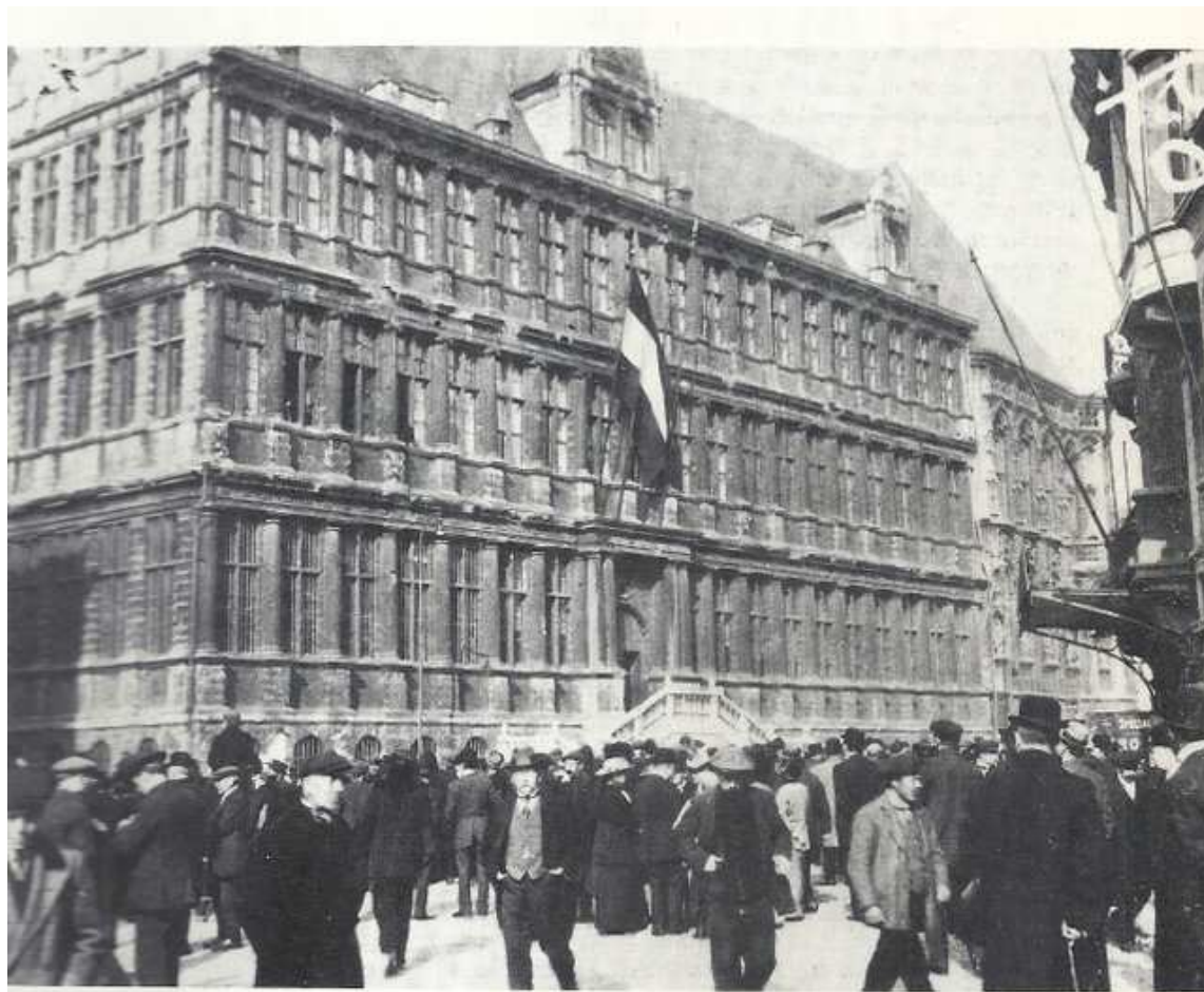
Volkstoeloop aan het stadhuis in 1914.