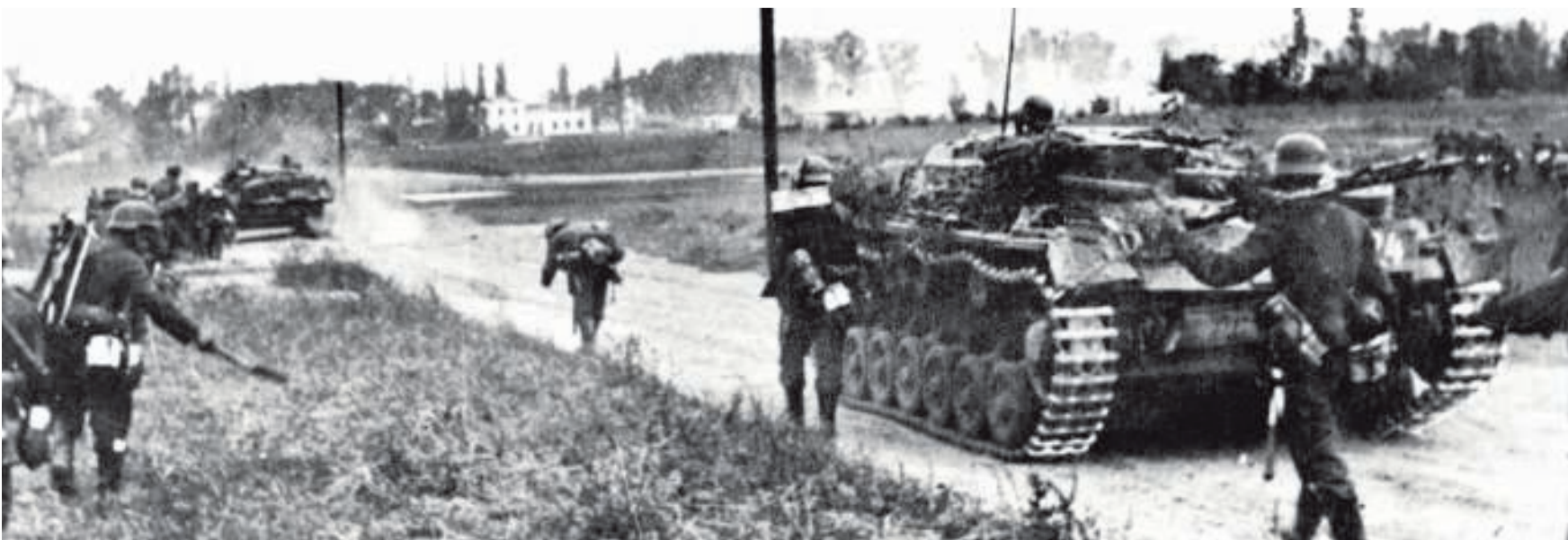
1 september 1939. Duitse troepen tijdens de inval in Polen. 53 divisies, 3.000 tanks en 2.000 vliegtuigen klaren de klus in goed twee weken.

KONING LEOPOLD III IN ZIJN RADIOTOESPRAAK