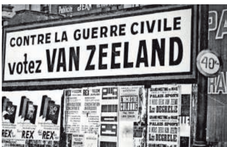
De inzet van de verkiezingen in 1937 is duidelijk: stem tegen de burgeroorlog, stem voor de zetelende premier Van Zeeland.

Na de zomer wil Léon Degrelle de regering-Van Zeeland op de knieën krijgen. Hij acht het moment gekomen om de macht te grijpen. Op 25 oktober plant hij een 'Mars op Brussel' met «250.000 rexisten». Van Zeeland verbiedt de mars en sluit de hoofdstad vermetisch af. In de gietende regen dagen slechts 5.000 betogers op. Daarop lokt Degrelle in Brussel een tussentijdse verkiezing uit en daagt Van Zeeland uit. Op vraag van de drie regeringspartijen neemt de premier de handschoen op. Aan de vooravond van de stembusgang van 7 maart 1937 geeft kardinaal Van Roey op verzoek van Van Zeeland duidelijk stemadvies: «Rex is een gevaar voor het land en voor de kerk». Van Zeeland haalt 76% van de stemmen, Degrelle 19%. De Rex-leider en zijn partij komen die klap nooit meer te boven. De regering-Van Zeeland II heeft ondertussen de buitenlandse en militaire politiek van ons land grondig herschikt. België stelt zich voortaan 'onafhankelijk' op. In de hoop dat de oorlog aan onze deur passeert.