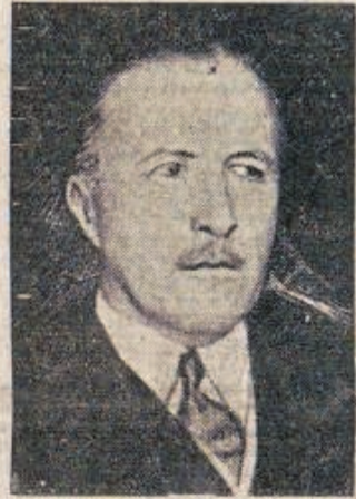
Sir Phipps, Britsch ambassadeur te Berlijn

De geest van het verdrag van Versailles had voor gevolg, dat een onderscheid werd gemaakt tusschen overwonnenen en overwinnaars. Dit onderscheid heeft de