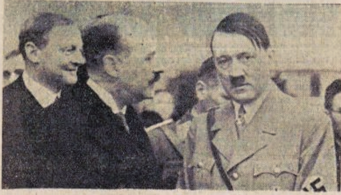
Rijksleider Hitler in gesprek met den Franschen ambassadeur, François Poncet

Verklaring van Hitler in den Rijksdag. - De rijksregering biedt aan te onderhandelen over een nieuw verdrag, en weer lid te worden van den Volkenbond OPHEFFING VAN DE DEMILITARISATIE VAN HET RIJNGEBIED