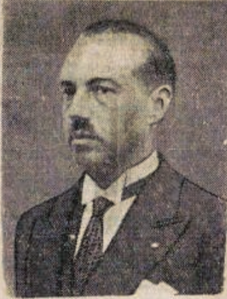
De n. Van Zeeland, eerste-minister en minister van Buitenlandse Zaken

Gansch de kwestie van den Europeeschen vrede staat hier nogmaals op het spel. De toestand dient kalm, zonder vooringenomenheid, doch ook met de grootste waakzaamheid gevolgd.