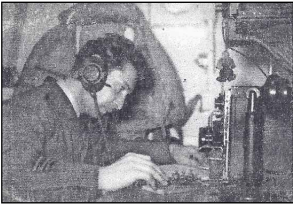
1958: ON4TJ aan de seinsleutel

je natuurlijk aan je zendtoestel gekluisterd als je een SOS hoort.