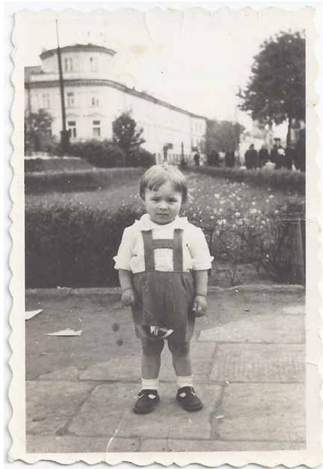
Foto met achteraan een bedankingstekstje: 'Ten teken van mijn hartelijke dankbaarheid om mij gered te hebben. Eeuwige gedenkenis... Marus.'

Maar sindsdien hoorde ik er jammer genoeg niks meer over. Misschien kruip ik nog wel eens in mijn pen of stuur ik een e-mail naar mijn Poolse vrienden.